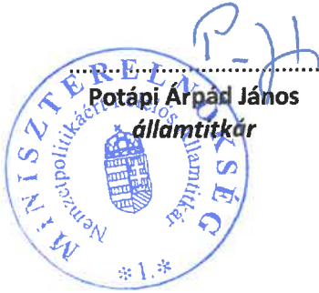
Potápi Árpád János államtitkár

A Bizottság felhívja a Bethlen Gábor Alapkezelő Zrt.-t, hogy a jelen határozatban foglaltak végrehajtása érdekében a szükséges intézkedéseket tegye meg.