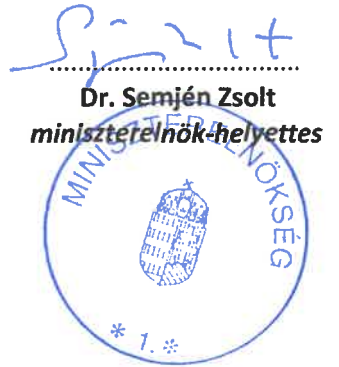
Dr. Semjén Zsolt miniszterelnök-helyettes